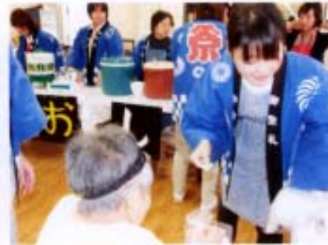
食欲の秋。甘味コーナー

わた飴・お汁粉・甘酒、とご用意しました。皆さん美味しく召し上がっていらっしゃいました。