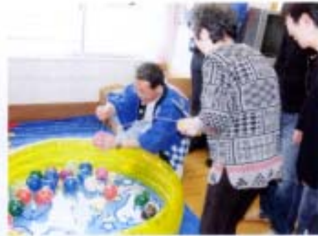
狙え!!ヨーヨー釣り

会場を包む、その素晴らしい音色に皆さん酔いしれました。笑顔の方、うっとりする方、懐かしい表情を浮かべる方・・・とても楽しい時間を過ごしました。