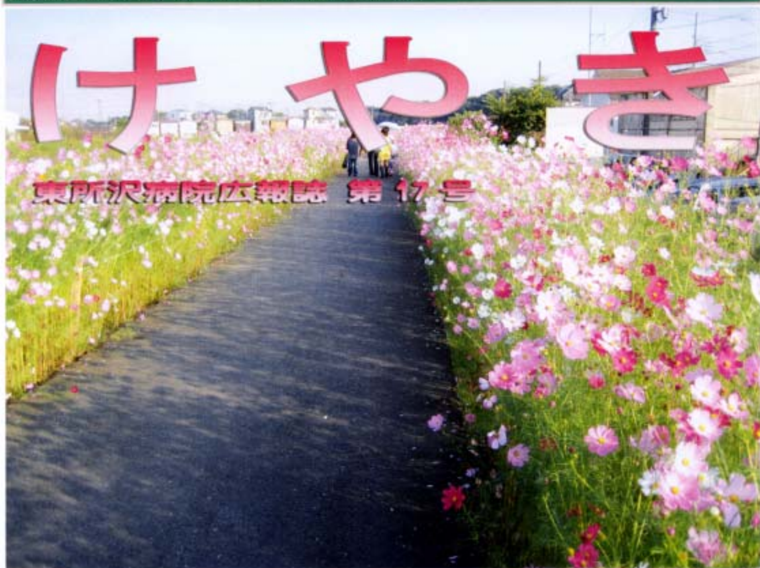
新河岸川貝塚付近のコスモス畑