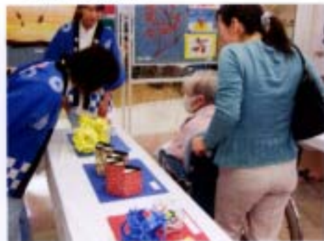
芸術の秋。患者様作品展

この三投にすべてを・・・わっかは狙い通りだったでしょうか。景品は可愛らしいガーベラの花。