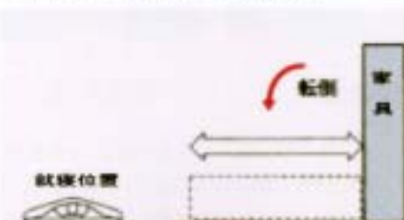
就寝位置を家具の正面にする場合は家具の高さ以上に距離をとる